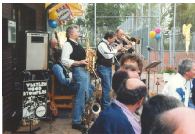
Schleifchenturnier mit musikalischer Untermalung durch die „Western Wood Stompers“