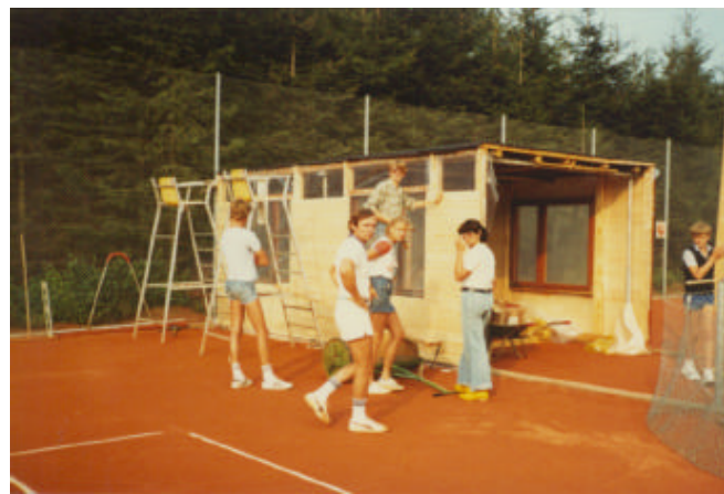
Bau der Hubertushütte