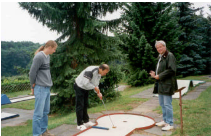
Tennisspieler beim „Golfen“