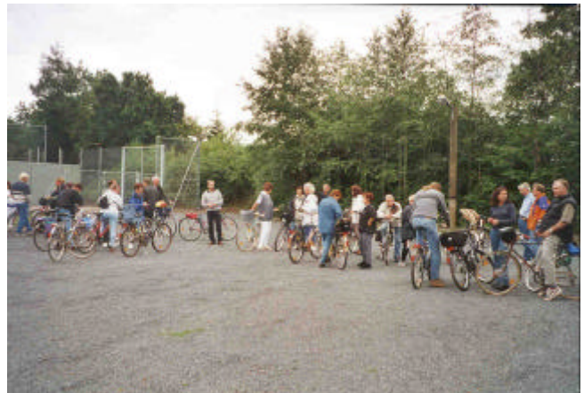
Start zum Überraschungstag am 8. Juli