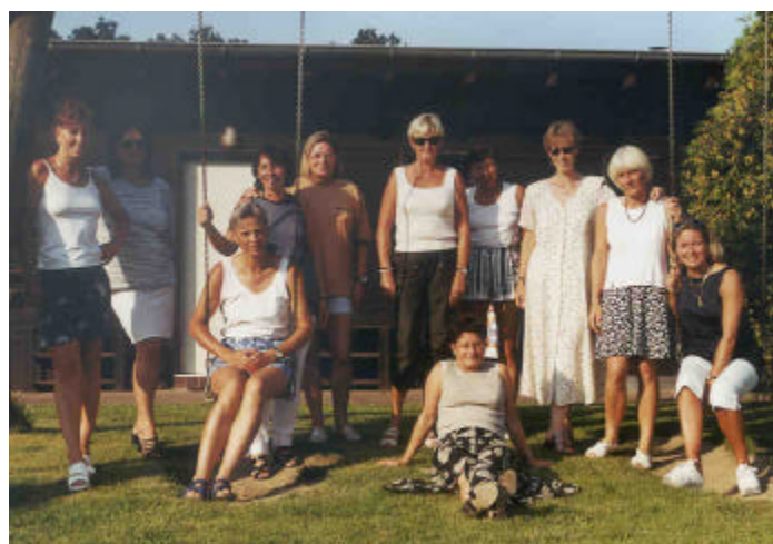
Aufstieg der Damen 40 in die 1. Kreisklasse