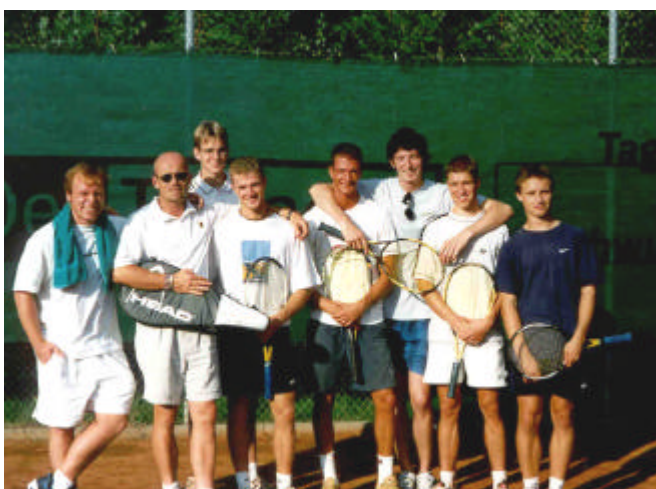
Aufstieg der 1. Herren in die 2. Verbandsliga