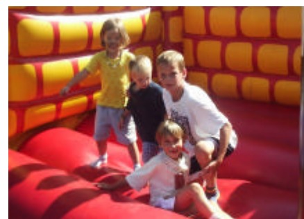
Die Hüpfburg kam gut an.