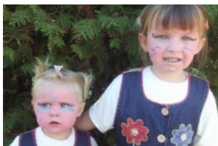
Sind sie nicht süß ?