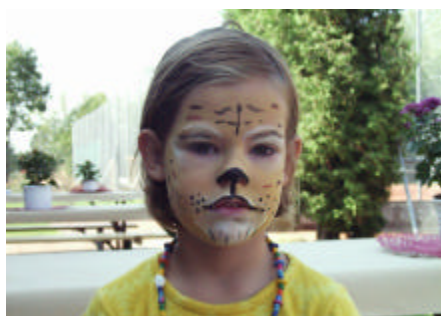
Lena als Katze