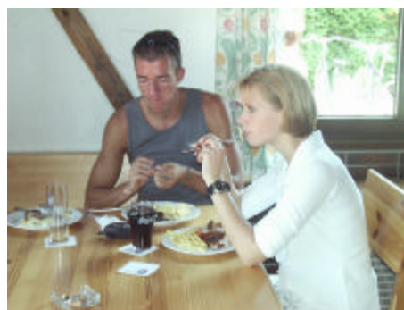
Fritten „rot weiß“