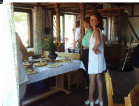
Kuchen ohne Ende.