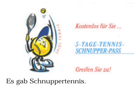
Es gab Schnuppertennis.